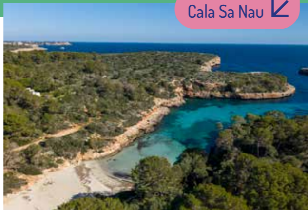
Cala Sa Nau