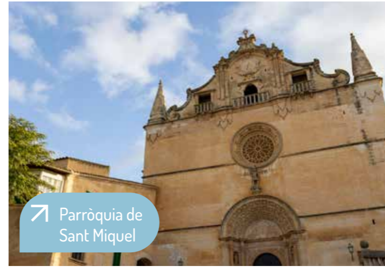
Parròquia de Sant Miquel