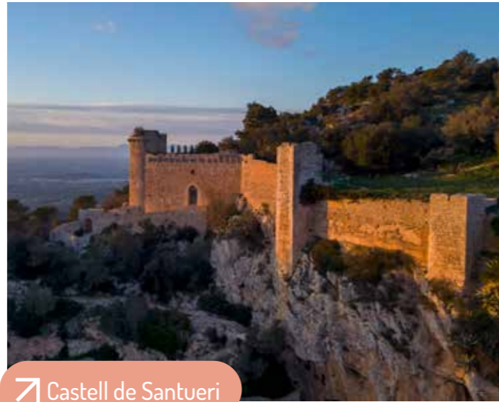
Castell de Santueri

De la etapa romana y árabe se han encontrado fragmentos de cerámica y una necrópolis en el centro histórico, así como topónimos de origen árabe como Binifarda. También existían pequeños núcleos de casas en la zona del Sitjar, como la alquería Mancorme Abeniara. El Castell de Santueri fue una fortaleza clave tanto en época romana como musulmana. El origen del nombre de Felanitx podría ser árabe (Felhani / Falhanis, "hondonada") o latino (foenaličius, "lugar de mucho lastón").