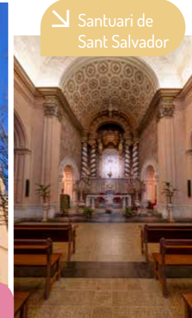
Santuari de Sant Salvador