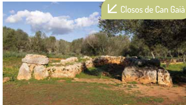
Closos de Can Gaià