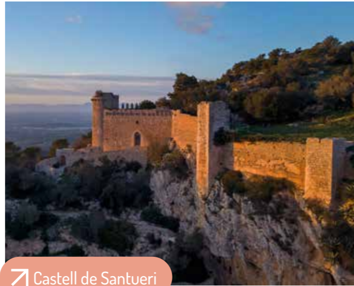
Castell de Santueri

Im historischen Zentrum wurden Keramikfragmente und eine Nekropole aus der römischen und arabischen Zeit gefunden, ebenso wie Ortsnamen arabischen Ursprungs wie Binifarda. Auch im Gebiet von Sitjar gab es kleine Häusergruppen, wie beispielsweise den Bauernhof Mancorme Abeniara. Das Castell de Santueri war sowohl in römischer als auch in muslimischer Zeit eine wichtige Festung. Der Name Felanitx könnte arabischen Ursprungs sein (Felhani / Falhanis, „Mulde“) oder lateinischen Ursprungs (foenalicus, „Ort mit viel Heu“).