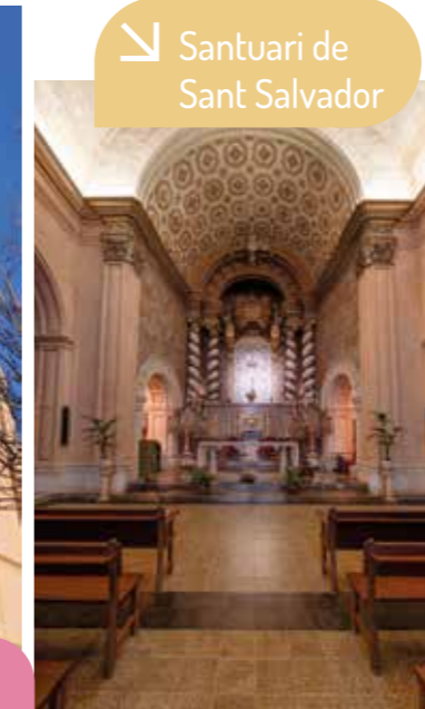
Santuari de Sant Salvador