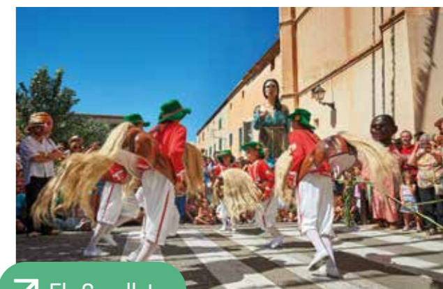
↗ Els Cavallets