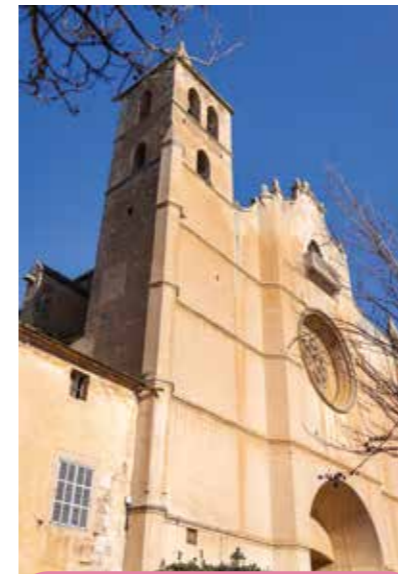
Convent Sant Agustí