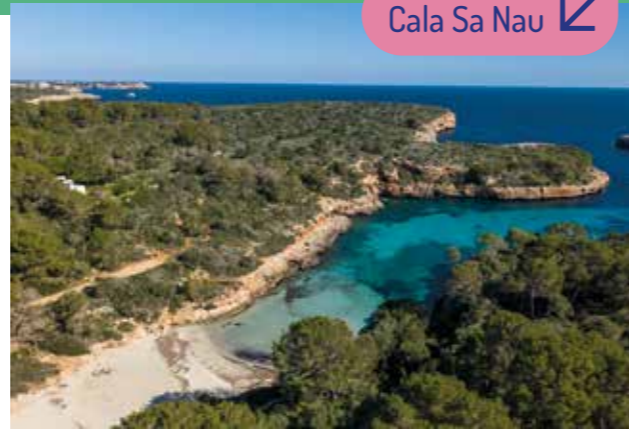
Cala Sa Nau