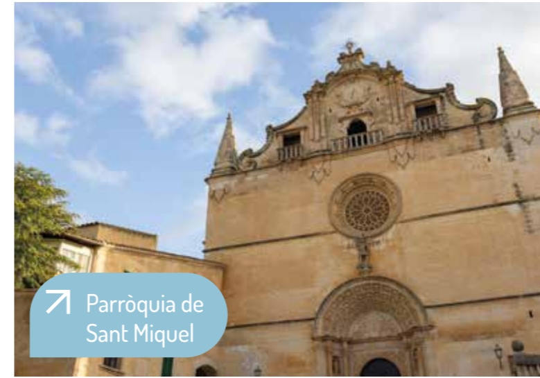
Parròquia de Sant Miquel