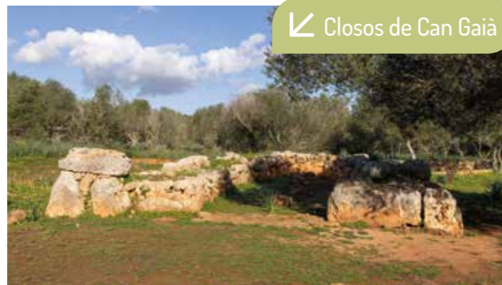
Closos de Can Gaià