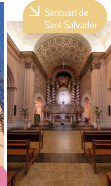
Santuari de Sant Salvador