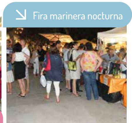
↘ Fira marinera nocturna