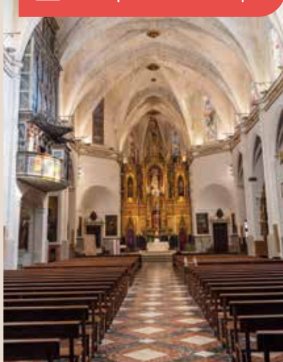
↳ Parroquia de Sant Miquel

Les amateurs d'archéologie trouveront à Felanitx un site clé : le village de Closos de Can Gaià, près de la côte, qui date de l'âge du bronze et se compose de spectaculaires navettes en forme de bateaux renversés, classées bien d'intérêt culturel. Les fouilles récentes ont permis de mieux comprendre comment vivaient ces communautés et comment était organisé ce site, ce qui constitue un élément clé pour comprendre le passé le plus lointain de la commune.