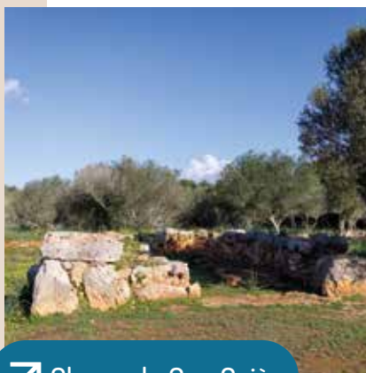
↗ Closos de Can Gaià