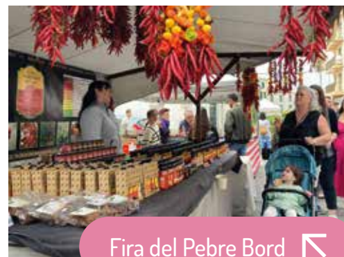
Fira del Pebre Bord ↖

La Fira Marinera nocturne remplit le port de Portocolom d'artisanat et de gastronomie liés à la mer, souvent dans le cadre des fêtes de la Mare de Déu del Carme. Une nuit pour profiter des stands, des produits locaux et du charme unique du port illuminé.