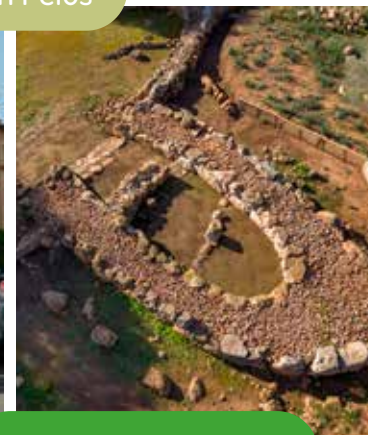
↗ Closos de Can Gaià