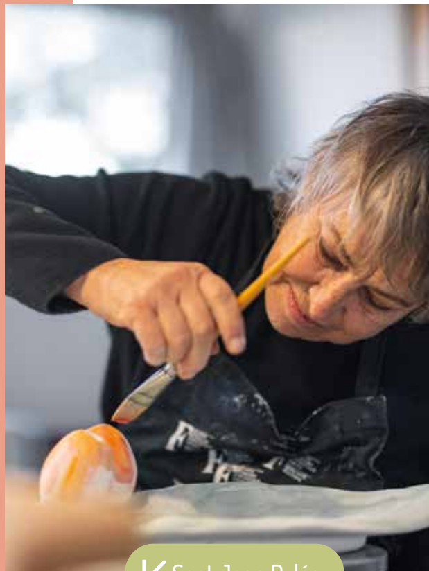
↙ Sant Joan Pelós

Al mismo tiempo, los mercados semanales, las ferias especializadas de vino, almendra o producto local y la actividad de los artesanos —cerámica, Gerreta felanitxera, trabajos en madera, vidrio o hierro— ofrecen una experiencia auténtica al visitante, que puede disfrutar del patrimonio, saborear la gastronomía y llevarse a casa un pedacito de la cultura del municipio. Este folleto te acompaña a descubrir todo este universo de patrimonio y cultura que hace de Felanitx un lugar único en Mallorca.