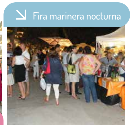
↘ Fira marinera nocturna