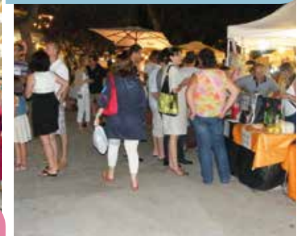
↘ Fira marinera nocturna